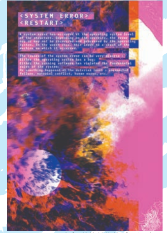
SYSTEM ERROR (リバリ装飾美術館ポスター) Anette Lenz (Germany) 2020