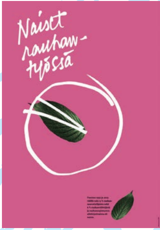
Women in peace work 平和を作る女性たち Marjatta itkonen (Finland) 2021

これまで当館に関わりのある女性デザイナーに呼びかけ、さらに彼女達の推薦するデザイナーにネットワークを広げた。この大垣で世界の優秀な女性デザイナーたちの力強いビジュアルメッセージ