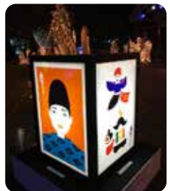
芭蕉元禄大垣イルミネーションでの展示