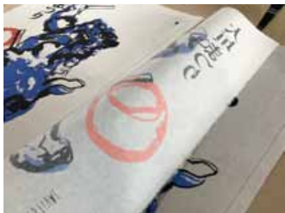
シルクスクリーン印刷の美しい仕上がりに

当館では、国重要無形民俗文化財である「大垣まつり」執行事がユネスコ無形文化遺産に登録されることを祝して、日頃お世話になっている世界のデザイナーに記念のポスターの作成を依頼しました。