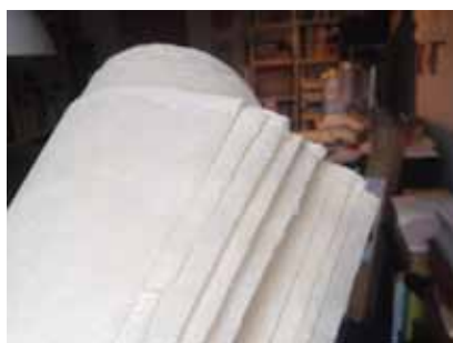
本美濃紙の風合い