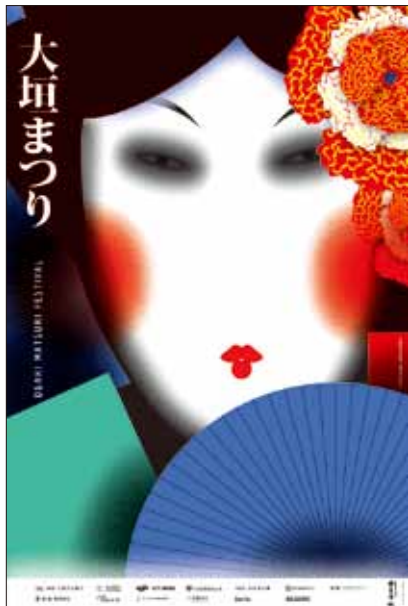
ホアン・マチャド/ポルトガル Joao Machado/PORTUGAL

本美濃紙にシルクスクリーン印刷 (本美濃紙:サイズ 90.0cm×66.6cm(横位置)、ポスター:サイズ 60cm×90cm(縦位置))